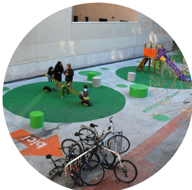
RECUPERACIÓN DE SOLARES SIN USO PREVISTO A LARGO PLAZO