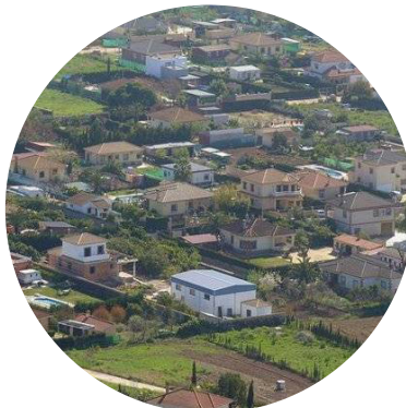
LEVANTAMIENTOS Y CERTIFICADOS AFOs