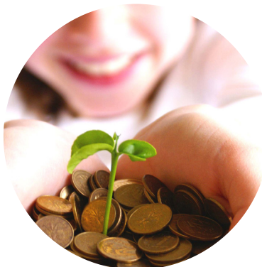
MEJORA DE EFICIENCIA ENERGÉTICA DE EDIFICIOS DE TITULARIDAD PÚBLICA