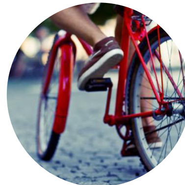
PEATONALIZACIÓN E IMPLANTACIÓN DE CARRIL BICI EN CASCO HISTÓRICO