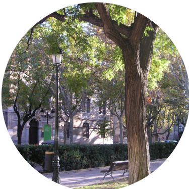
INFORMES DE ARBOLADO EXISTENTE, PATOLOGÍAS Y MANTENIMIENTO