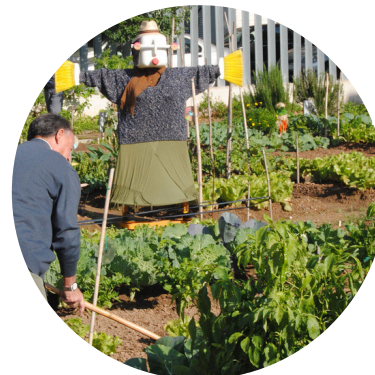
IMPLANTACIÓN Y GESTIÓN DE HUERTOS URBANOS