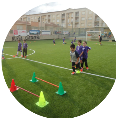
GESTIÓN DE FONDOS FEDER PARA PROYECTOS DE DESARROLLO LOCAL