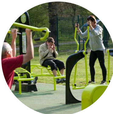
UBICACIÓN DE INSTALACIONES DEPORTIVAS Y LÚDICAS AL AIRE LIBRE